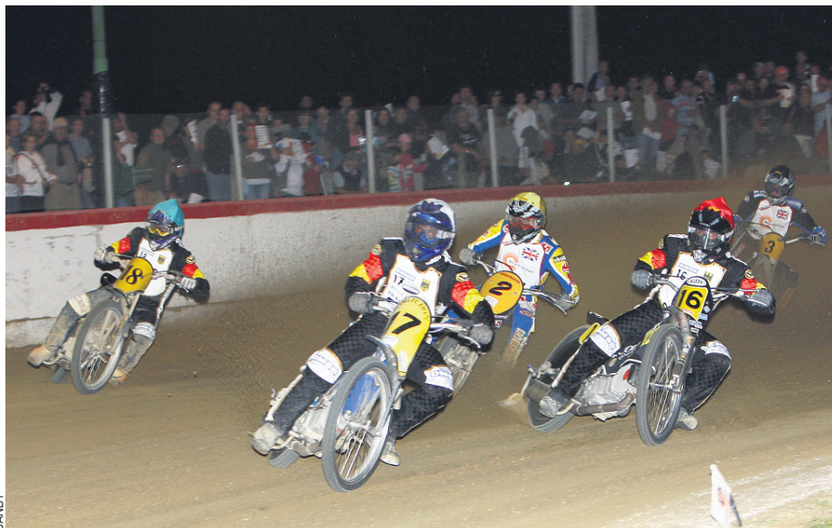
Das deutsche Team konnte die Engländer schon im Vorlauf schlagen: Katt (17) und Riss (16) lagen vorne

Endstand: 1. Prumm, 133. 2. Lancelot 114. 3. Franke 114. Papenmeier 104.